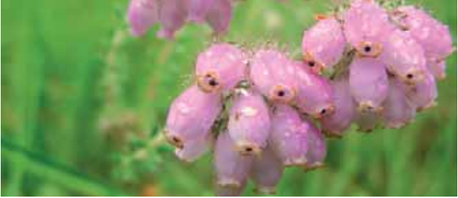
Bruyère à quatre angles

A cette saison, le jaune de la Narthécie se mélange au violet des bruyères, donnant un attrait tout particulier à la tourbière des Dauges. Visite accompagnée d'un guide qui vous fera sortir des sentiers battus pour observer les espèces végétales et animales spécifiques de la réserve.