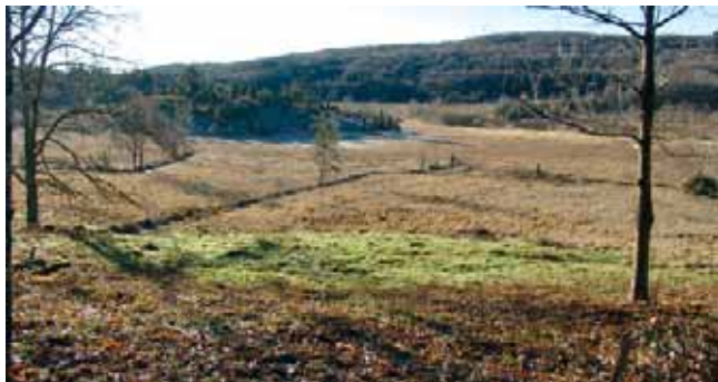
La tourbière et le puy rond