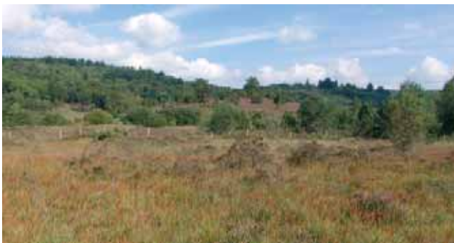
Vue générale de la Réserve

Randonnée découverte de la Tourbière des Dagues, histoire des lieux et de ses petits habitants. Cette sortie sera ponctuée d'exercices de décontraction faisant appel à différentes techniques de respiration.