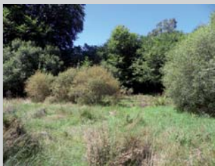
Développement de Saules