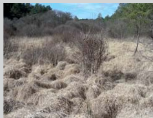
Abandon de pâturage

Quelques chiffres* sur le Réseau Zones Humides : - En Limousin, ce sont 90 adhérents pour plus de 600 ha de milieux humides, dont 1 adhérent sur la Communauté de communes Bourganeuf-Royère-de-Vassivière. La dynamique de réseau s'amorce lentement bien que les problématiques soient identiques à celles d'autres territoires. N'hésitez pas à nous contacter.