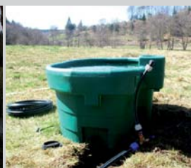
Abreuvoir hors d'eau