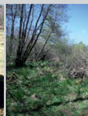
Remise en pâturage