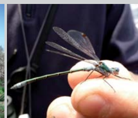
Découverte de la faune et flore