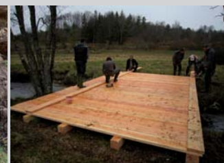
Passerelle pour bétail