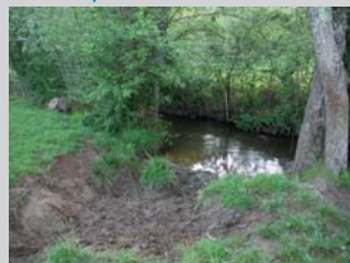
Erosion de berges