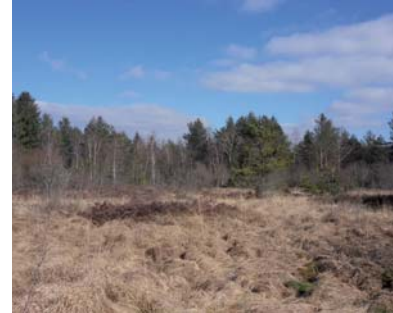
Parcelle en déprise

L'étude ainsi menée en 2013 sur ce secteur visait essentiellement les parcelles en déprise sur lesquelles pourraient être réintroduites des activités, notamment agricoles afin de préserver la qualité des milieux humides et aquatiques. Cela ne pourra s'effectuer qu'en partenariat avec les acteurs locaux et les propriétaires.