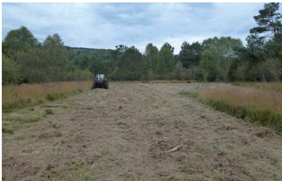
Fauche de restauration

Les zones humides des Rédoudaudas sur la commune de Beaumont du Lac, au sud du village de Pert sont actuellement en cours de restauration. Propriété de la commune de Beaumont-du-Lac, le partenariat s'est concrétisé par la signature d'un bail avec le CEN Limousin en 2012 et une convention avec l'Office National des Forêts. Identifiées par le Syndicat Monts et Barrages en 2007, elles ont suscité un intérêt de la part du CEN Limousin. En effet, d'une surface conséquente (16 ha), ces zones humides diverses abritent une biodiversité riche, participent à la qualité et à la quantité de la ressource en eau du bassin versant et composent un paysage de fond de vallée remarquable.