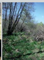
Remise en pâturage