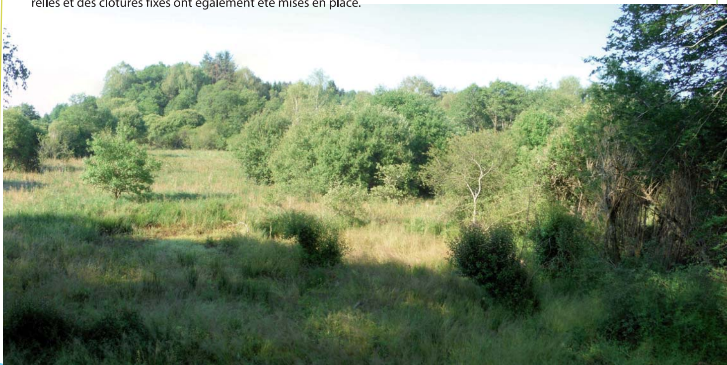
Vue générale des zones humides des Rédoudaudas

L'entretien est assuré par le pâturage de troupeaux d'éleveurs locaux de même que la fauche. C'est pourquoi des passerelles et des clôtures fixes ont également été mises en place.