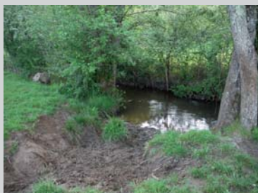
Erosion de berges