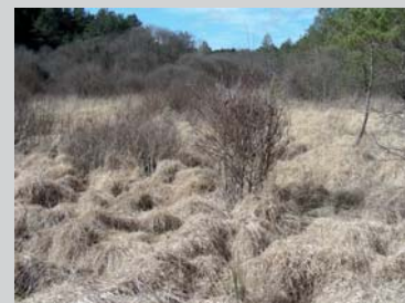
Abandon de pâturage