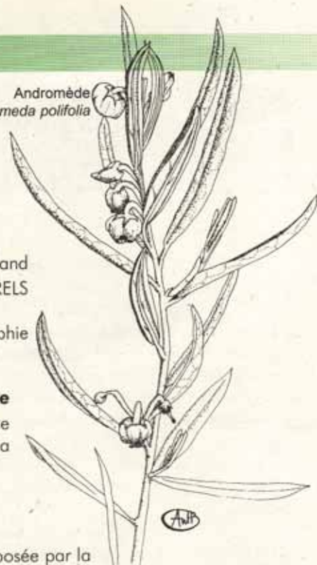
Andromède Andromeda polifolia