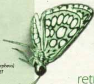
Le Miroir (Heteropterus morpheus)

Le site sort juste de sa coquille, alors merci d'être indulgent et surtout, de nous faire part de vos remarques : nous nous efforcerons de rendre le site toujours plus attractif !