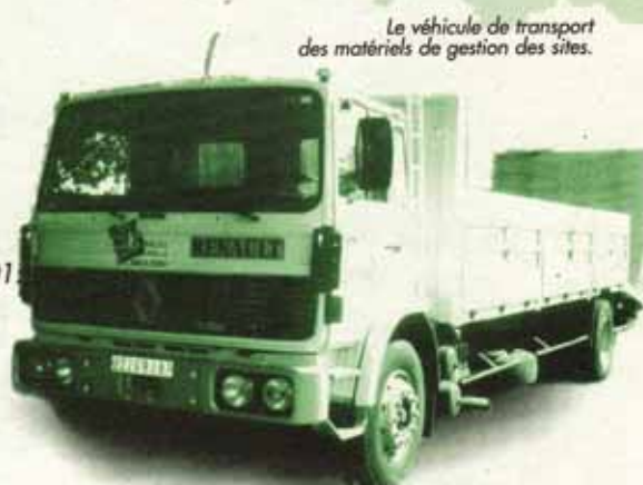
Le véhicule de transport des matériels de gestion des sites.