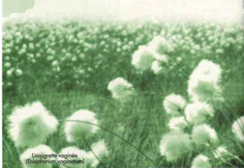
Linaigrette vaginée ( Eriophorum vaginatum )

ESPACES NATURELS DU LIMOUSIN est une association créée en 1992 dont la mission est d'étudier, de préserver et de mettre en valeur le patrimoine naturel de notre région, en étroite concertation avec les acteurs locaux. En Corrèze, Creuse et Haute-Vienne, le Conservatoire contribue ainsi à la sauvegarde de la biodiversité par la conservation des espaces naturels les plus exceptionnels (tourbières, landes, marais, pelouses calcaires et serpentines, forêts etc.).