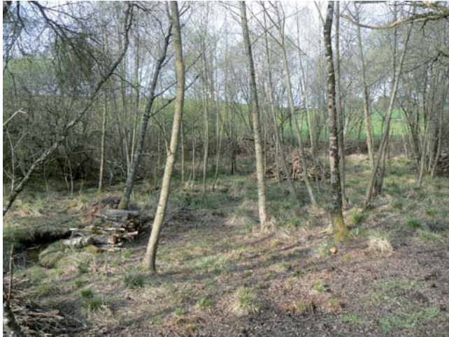
Parcelle après nettoyage

La parcelle était totalement inaccessible, car envahie de ronces et de saules cassés. Le cours d'eau était par endroit totalement bouché par des racines et des branchages.