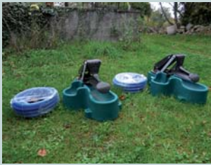
Pompes à museau ou pompes de prairie

Vous pouvez l'emprunter. Contactez-nous !