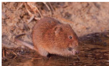
Campagnol amphibie.

Comme son nom l'indique, le Campagnol amphibie affectionne essentiellement les milieux humides (rives des ruisseaux, mares et étangs, et les zones humides).