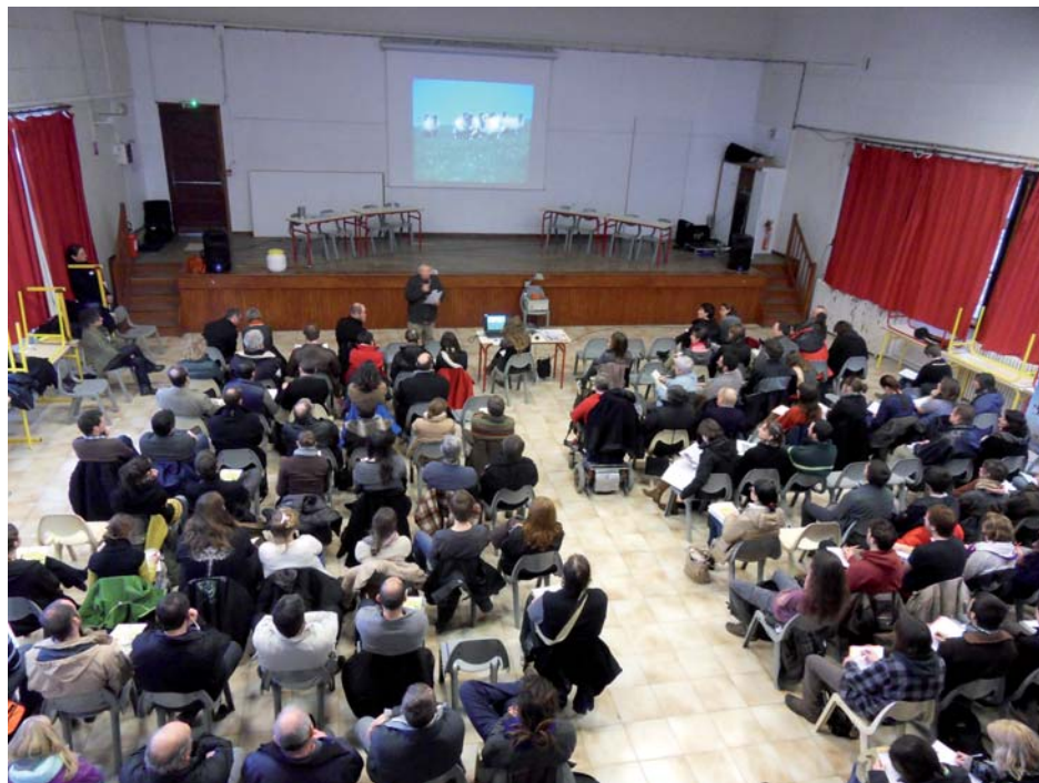
Salle comble lors de l'ouverture des premières rencontres par Gérard Migotti

Comme vous le savez, à l'occasion de la journée mondiale des zones humides du 2 février 2013, les premières rencontres du Réseau Zones Humides en Limousin ont eu lieu au Lycée agricole de Neuvic (19).