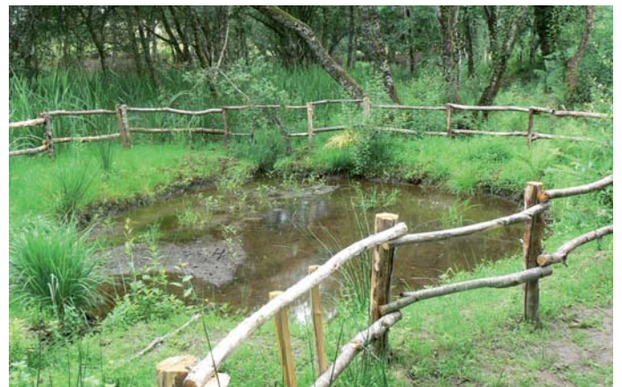
Mare après nettoyage

La ferme des histoires mélangées est un domaine bio d'une cinquantaine d'hectares de bois et de prairies sur la commune de Sexcles au sud de la Corrèze. C'est aussi un lieu d'accueil depuis 2010 avec 3 cabanes qui peuvent être louées à la nuitée toute l'année.