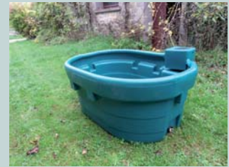
Bac d'alimentation en eau pour abreuvoir gravitaire