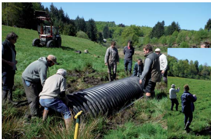
Installation de l'arche PEHD dans le ruisseau

Dans le cadre de l'animation du Réseau Zones Humides en Limousin, les animateurs proposent tout au long de l'année des journées d'échanges et chantiers afin de sensibiliser, informer et former les membres du Réseau à la préservation de la ressource en eau, mais également dans le but de les assister dans leur démarche. C'est ainsi que 2 chantiers ont été organisés la même journée :