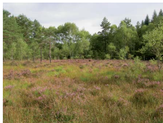
Lande humide des Chaux (Clergoux, Saint-Pardoux-la-Croisille, Espagnac - 19)

POUR EN SAVOIR PLUS : Guide de gestion des landes - CEN Limousin - BON-HOMME 2011 (voir p4)