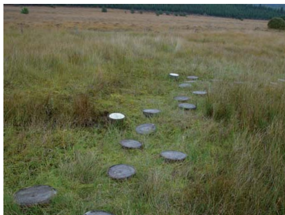
Pas Japonais aménagés à la tourbière du Longeyroux (Meymac, 19)