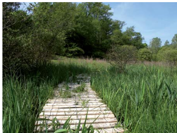
Caillebotis aménagés au Domaine de Mayéras (Verneuil sur Vienne, 87)