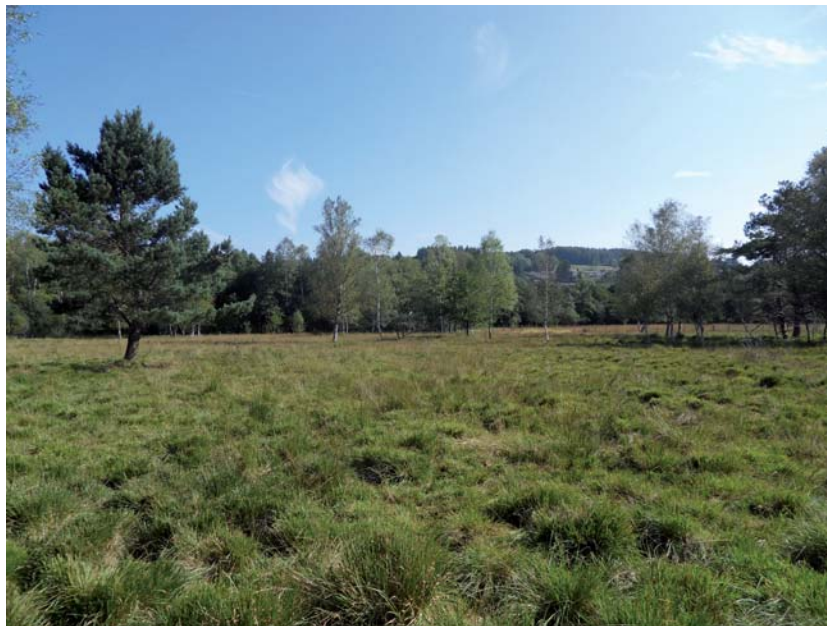
Prairie humide pâturée par les bovins (Faux-la-Montagne, 23)

Présentation de la ferme par Jouany Chatoux