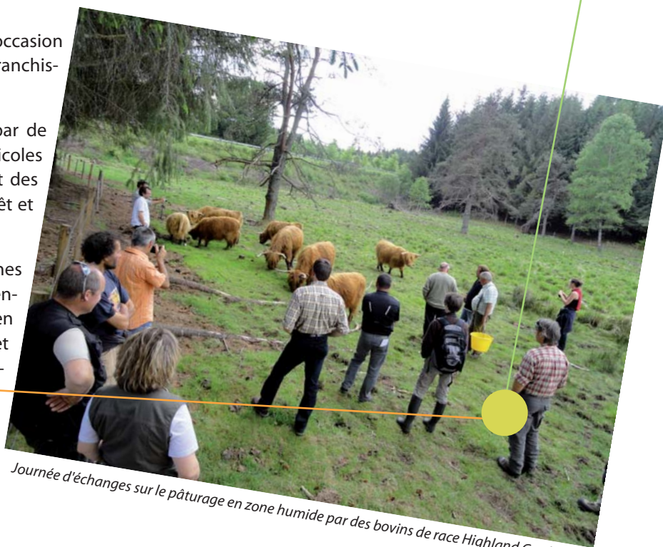
Journée d'échanges sur le pâturage en zone humide par des bovins de race Highland Cattle

Enfin, les supports de communication actuels (bulletins de liaison, plaquettes de présentation) sont de bons outils pour le territoire sur lequel le Réseau Zones Humides commence à être bien connu et où le nombre d'adhérents est conséquent. En rejoignant le réseau vous bénéficierez de ces documents et pourrez contribuer à leur rédaction.